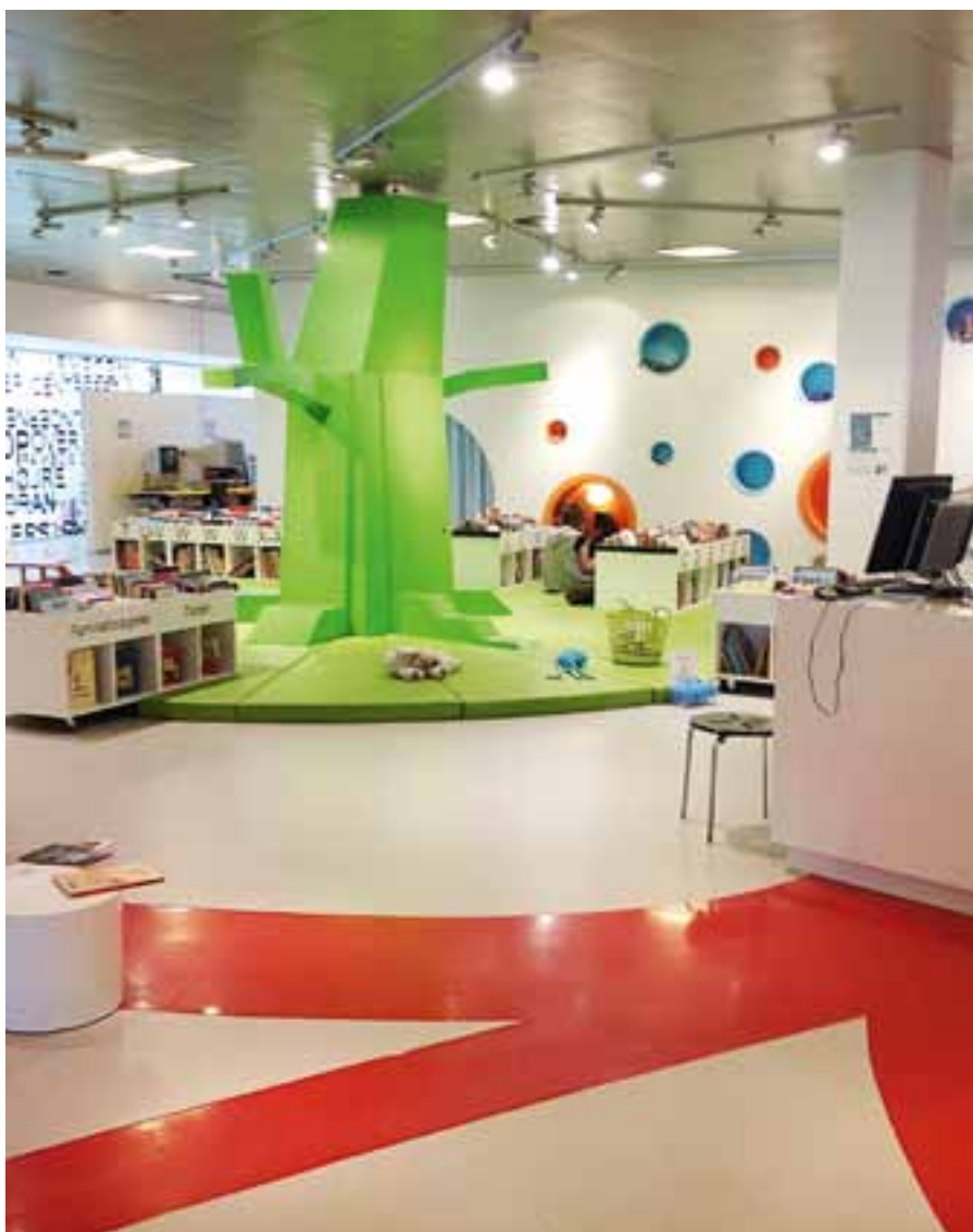
Biblioteken i Danmark upplevdes som riktiga familjebibliotek där upplevelse var ett genomgående tema. Ödeshögs bibliotek vill skapa något liknande.

Det vi ändå mest prioriterar är satsningen på den digitala delaktigheten. Vi besökte PRO och SPF på