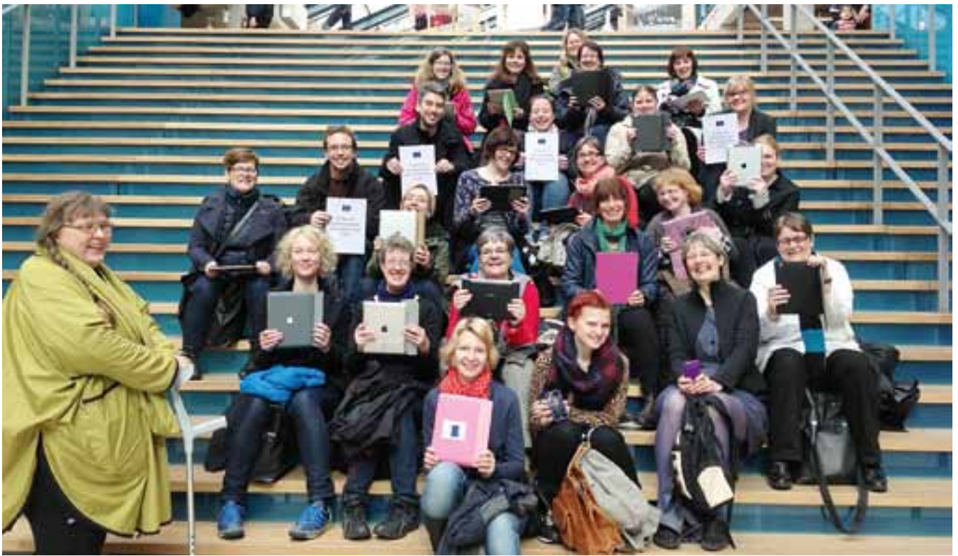
En studieresa gick till Holland. Deltagarna har surfplattorna redo för att dokumentera resan.