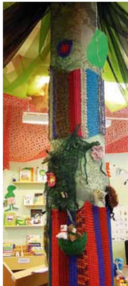
Linköping Knitters tänkte på att sticka en stam till trädet i Ljungsbro bibliotek.

Det här var hösten 2011 och vintern 2012 och nu hösten 2013 är det ett grundgäng på ca 10 stycken som träffas här varje måndag och ibland är de fler, ibland något färre. De har bildat en studiecirkel och har haft garnvisning från en affär en kväll vilket var mycket uppskattat och kanske blir det ett studiebesök i vår innan det är dags att ta sommaruppehåll, vi får se vad pengar och energi räcker till.