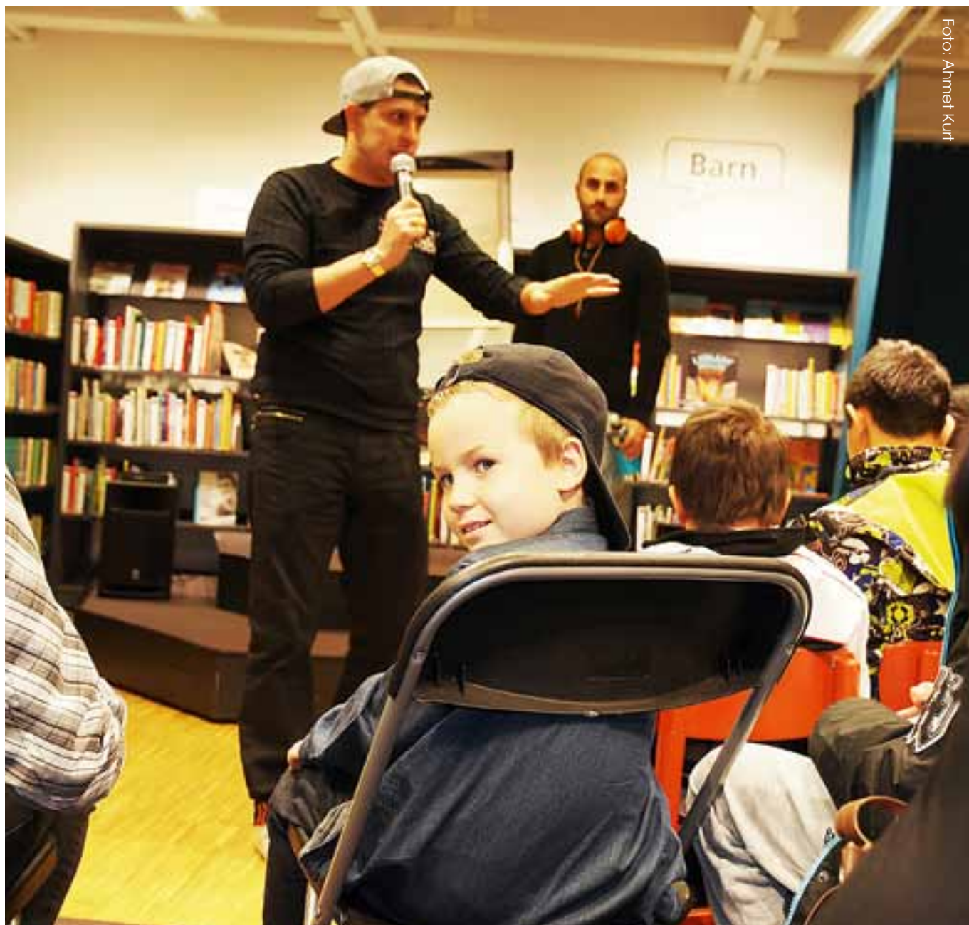
Douglas León, det vill säga Dogge Doggelito var frontfigur i gruppen Latin Kings, ett av den svenska rappens första band. I Hageby ville han inspirera nästa generations rappare.

Rim och rytm måste man ha, för att rappen ska flyta bra.