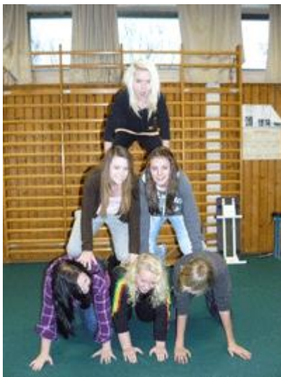
Bokevent i Ödeshög

Den 5/11 samt 13/11 hände det sig därför att totalt 75 elever i åk 8 sitter på golvet i en gymnastiksal och förväntar sig något som varken bibliotekarie, kulturaktör eller projektledare har aning om.