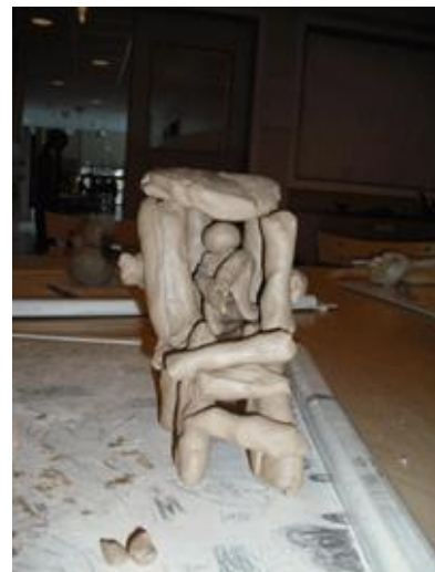
Lerfigur från Boxholm