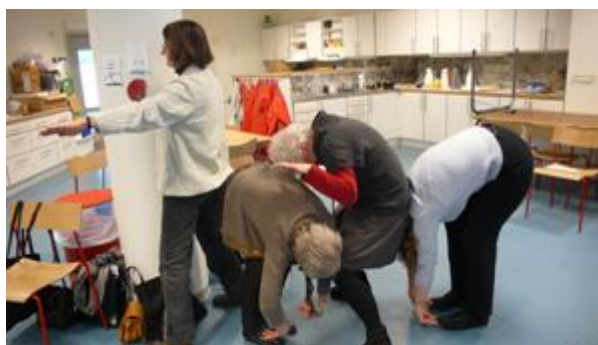
Barnbibliotekarier på dramaworkshop

•Barnbibliotekarierna Förhoppningen är att barnbibliotekarierna genom att ha medverkat i ett bokevent och fortbildningstillfällen inom projektet fått verktyg som de kan använda. Kan man titta på metoderna inom Bokens alla sidor som ett förhållningssätt till bokens innehåll och presentation och kan bibliotekarierna inom sina tjänster samverka med andra institutioner finns lösningar att finna.