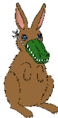
Ärlighet.