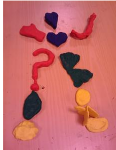
Bibliotekarie av lerkluttar

Har bokeventen gjort någon bestående skillnad för bibliotekariernas sätt att arbeta med läsfrämjande insatser?